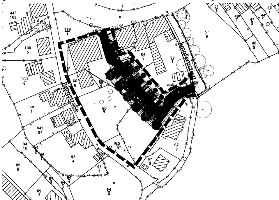
Abbildung 1: Ausbauplanung der öffentlichen Parkplatzanlage, Ing.-Büro Dänekamp+Partner, Stand: Mai 2013

Geplant ist eine Anbindung der öffentlichen Parkplatzanlage an die Paul-von-Schoenaich-Straße und an den Jungfernstieg. Im Rahmen der Ausführungsplanung wird geklärt zu welchen Straßen die Zu- und Abfahrten ausgerichtet.